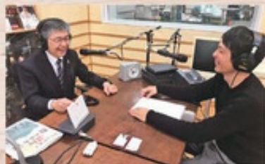
第2回ゲストは高知のスター☆岡崎市長